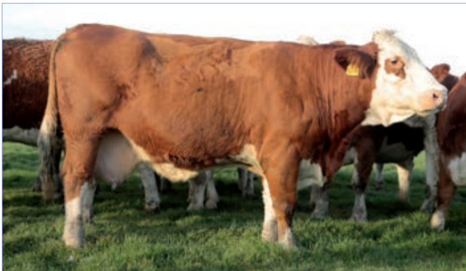
□ Dvanáctiletá kráva uš. č. 364 776 931 po kanadském Iroc Rocket (ZSI 401)

zásadní, když nám jde o kvalitní plemenná zvířata. Tahle cesta je jednoznačný progres. Nejlepší krávy se proto stále snažíme inseminovat, ale v současné době nám převládají zvířata po přirozené plemenitbě ze zjevných důvodů ☺. Přitom si pečlivě píšeme průběhy inseminací, pro porovnání, ale příroda je v tomto ohledu nevyzpytatelná, protože kolikrát z našeho pohledu beznadějně případy a zrovna se to povede.