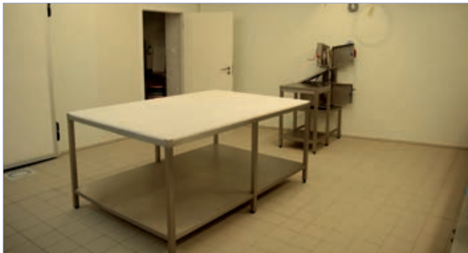
□ Vysněná bourárna funguje na statku v Křenovicích již čtvrtým rokem

Lenka: Z počátku jsme měli zvířata celoročně venku a bez přístřešků, ale postupně jsme se dopracovali k vybudování zimoviště, respektive čtyř obloukových hal o rozměru 6 x 6 m vedle sebe opatřených výběhem. Do prostoru před zimoviště se umístí kruhy na balíky a tam se krmí a zastýlá slámou. Na nedalekém sloupu proti halám jsou umístěny kamery, díky nimž je stádo pod dohledem, což je praktické zejména v době telení. Na zimoviště se naskladňuje dle počasí, ale zpravidla v průběhu listopadu. Ve chvíli, kdy tam dáme první balíky krmení, se stádo samo z pastviny dobrovolně stáhne. V tomto prostoru jsou do konce března nebo dubna podle počasí. Když není příliš mokro, tak se pustí třeba na malou část pastviny za rybníčkem a následně se otevře celý prostor. V jednom z přístřešků se vždy vytvoří školka pro telata, kde se přikrmují a mají možnost odpočívat. V přístřešcích na hluboké podestýlce se zvířata telí i odpočívají, ale mo-