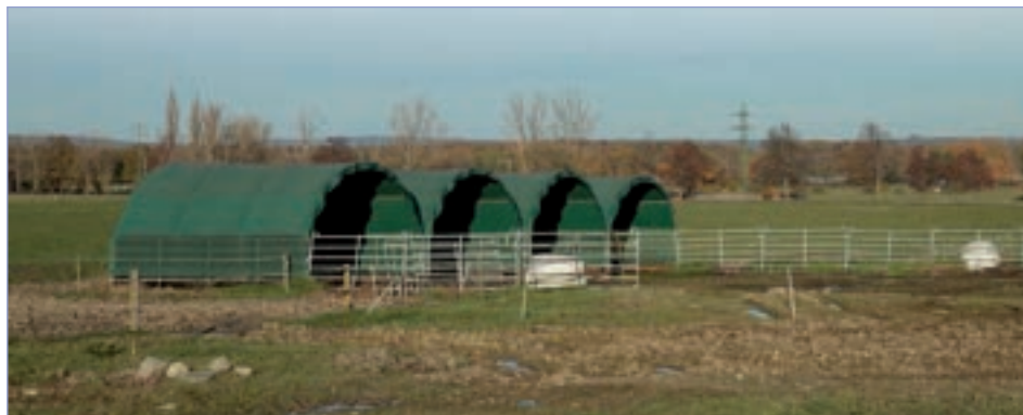
□ Čtyři obloukové haly s hlubokou podestýlkou slouží jako zimoviště, porodna a školka pro telata a jsou pod dohledem kamer

Telení máme nastavené od půlky ledna do konce března, tak aby nám většina býků vycházela na zařazení do druhého turnusu odchovu plemenných býků. Ono