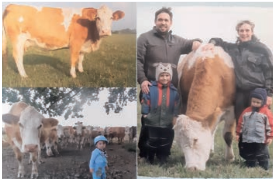
□ Matka pluku Máňa: žila 15 let, odchovala 13 telat (6 jalovic z toho bylo 5 chovných), 7 býků a všichni uznáni jako plemenní. Jako dárkyně embryí dala ještě 6 telat (4 chovné jalovice a 2 plemenné býky)

Máňa: 15 let (*31. 1. 2003 – +9. 1. 2018), 13 telat (6 jalovic z toho bylo 5 chovných), 7 býků a všichni uznáni jako plemenní. Díky jejímu využití jako dárkyně embryí přišlo na svět dalších 6 telat (4 chovné jalovice a 2 plemenní býci). Máňu nedokázali dát na jatka, takže se domluvili s doktorem na uspání, což byla forma poděkování za její odvedenou práci. Hodně je naučila a byla doslova členem rodiny. Najdete ji na celé řadě rodinných fotografií, vč. těch svatebních. V obýváku má své čestné místo na velkém obraze a je tak stále se svou rodinou. Na takové zvíře se nezapomíná a jen těžko ho nějaké další nahradí.