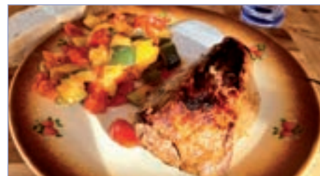
□ Výborný oběd: steaky z lopatkového plátku v podání Jakuba Placandy

Ceny se snažíme držet, i když zdražování energií se samozřejmě na ceně bude muset asi