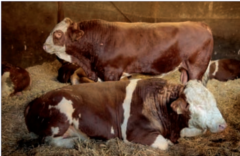
□ Ve věku 24 měsíců mívají býci ve výkrmu kolem 11 metráků

po 5–6 kg z toho co máme k dispozici. Třetí skupina zákazníků si bere třeba jen kosti nebo klišky apod. Organizačně je to tak, že na začátku měsíce odvezeme zvířata na jatka, domů přivezeme maso ve čtvrtích, rozbouráme a během doby, kdy maso zraje ve vakuu, tak rozdělují a připravím objednávky, následně rozešlu smsky a vyhlásím prodej, který bývá zpravidla v pátek odpoledne a v sobotu dopoledne. Klienti přijedou a přípravné balíčky si odvezou. Chodí i místní lidé a za to jsme moc rádi.