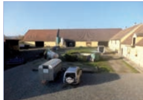
▣ Pohled na dvůr hospodářství z okna rodinného domu, na jehož místě stávala tvrz, v zadní části dvora je stodola, jejíž kořeny sahají až do 16. století