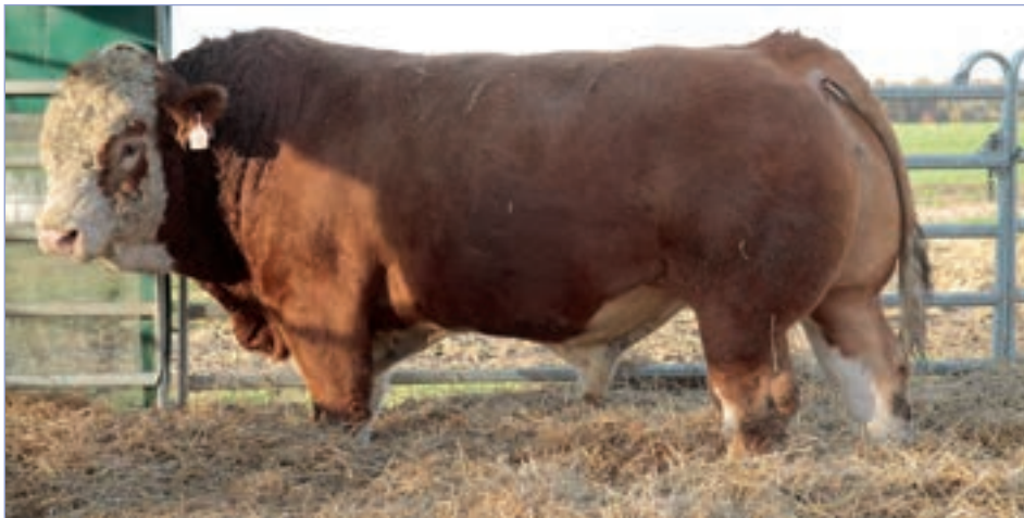
□ Plemenný býk Dumas z Ležnice P (ISI 083) z chovu pana Bartoně

hou využívat i nastlanou plochu kolem krmiště, kde mají k dispozici i vodu.