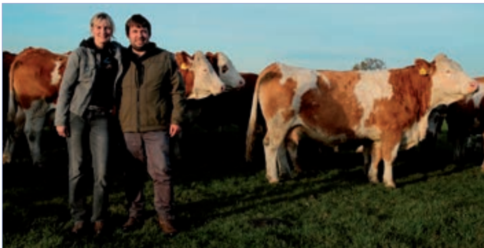
□ Placandovi se svým stádem – vpravo dcera Máni po United P (ZSI 400) Krása z Křenovic ET P (z NVHZ v Brně 2021 si odvezla pohár za 2. místo v kategorii krav)