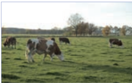
□ Stádo se pase celou sezónu na pastvině za statkem – v popředí Krása z Křenovic ET P

pravidlům využívání rohatých býků daří. Díky velkým rámcům se maso nabaluje o něco později, ale ve věku 24 měsíců mívají býci kolem 11 metrů. Jalovice se poráží v mladším věku, protože mají tendenci více zatučňovat.