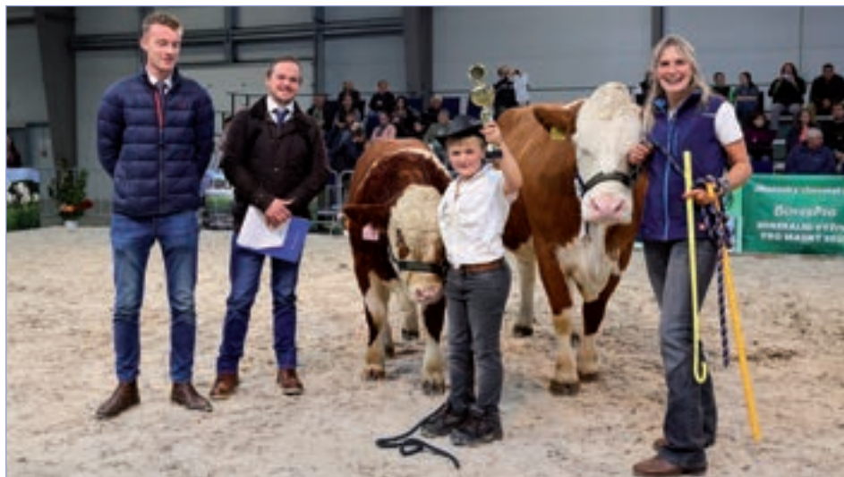
□ Simmental show v Lysé nad Labem 2022 (2. místo v kategorii krav) – ELI Z KŘENOVIC P, uš. č. 610471931 CZ (kat. číslo 61), dcera Krásky, vnučka Máni a matka Cháróna (to je rodina ☺)