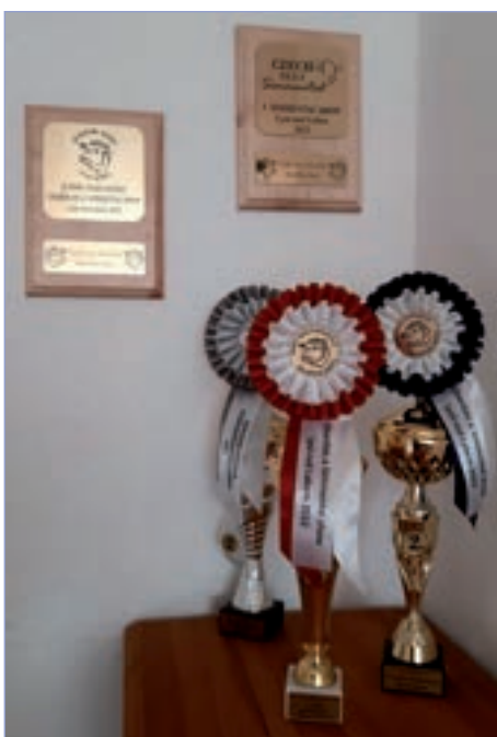
□ Ocenění z výstav

Soutěž Juior Teamu – 1. místo v I. kategorii 7–14 let (5 účastníků): Aleš Placanda (7 let) a vodil s kat. č. 38 Chárona s Křenovic P, který soutěžil v kategorii telat (syn Eli z Křenovic, která vyhrála II. místo v kat. st. krav, otcem Dumas z Ležnice P – ISI 083)