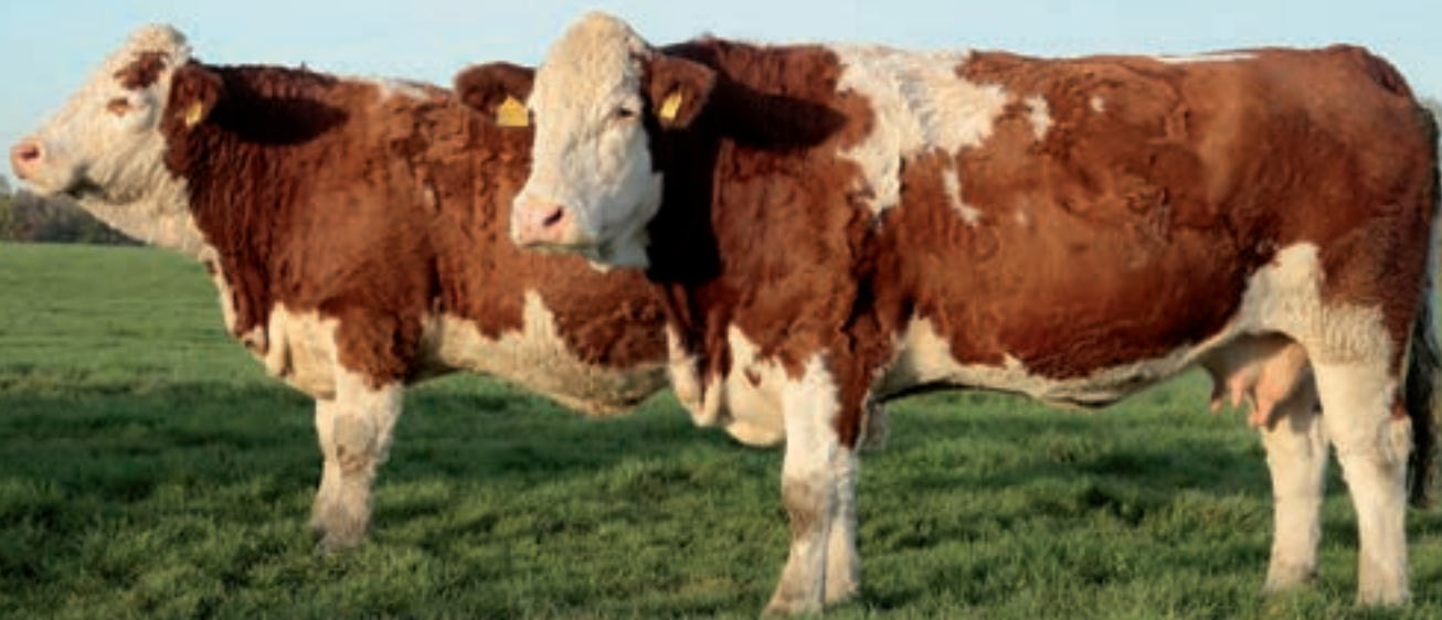
□ Od samého začátku se klade důraz na inseminace