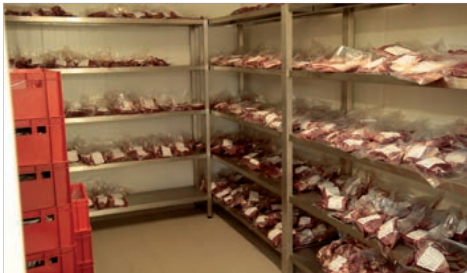
□ Prodej masa probíhá formou tzv. rodinných balení o hmotnosti 10, 15 a 20 kg, která obsahují jednotlivé zavakuované balíčky/partie s etiketou o hmotnosti kolem 1 kg

Vladimír: Kromě práce kolem farmy a v bourárně máme ještě další aktivity, například k nám