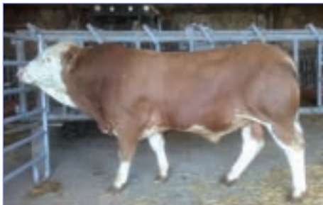
□ Historicky nejlépe hodnocený býk: Fénix z Křenovic PP (ISI 591) – nar. 20. 2. 2019 po Uman FM P (PMS 339) a Lucii z Křenovic ET V (hodnocen 86 b)