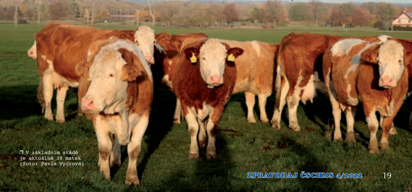
▣ V základním stádě je aktuálně 38 matek